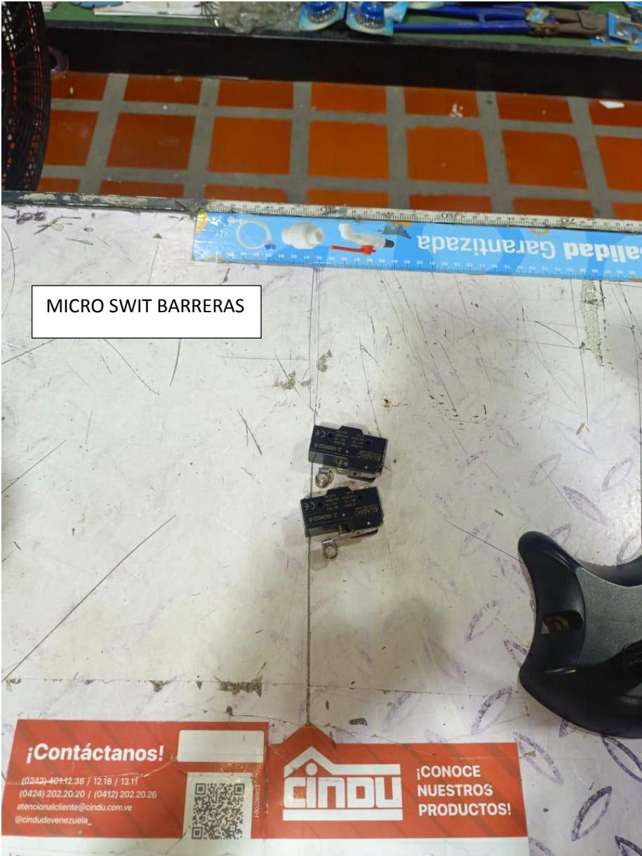
MICRO SWIT BARRERAS